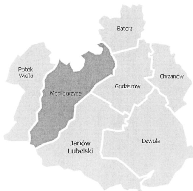
Rysunek 1. Gmina Modliborzyce w powiecie janowskim

Gmina Modliborzyce zajmuje obszar 153 km 2 . Według danych GUS z końca 2016 roku Gmina liczy 7.071 mieszkańców, a gęstość zaludnienia to w przybliżeniu 46 osoby/km 2 . Gmina Modliborzyce leży w centralnej części powiatu janowskiego. Bezpośrednio graniczy z następującymi jednostkami: Batorz, Godziszów, Janów Lubelski, Potok Wielki, Pysznica, Szastarka.